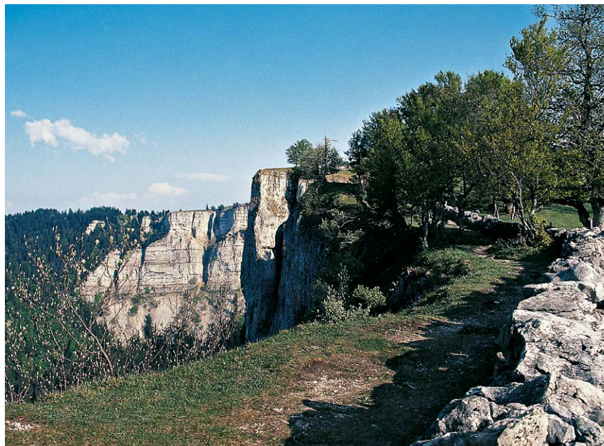
Vom Soliat fallen die Felswände 160 Meter tief in den Creux du Van ab.

Von der Ferme wandern wir nordwärts bis zum Felsgrat, der den Creux du Van gegen Norden abgrenzt und der als Le Dos d'Ane (Eselsrücken) bekannt ist. Am Ansatz dieses Rückens beginnt der Zickzackweg »Chemin des 14 Contours«, der sehr steil den Wald hinabführt. Bei den Gebäuden von Les Oeuillons (7) treffen wir auf eine Verzweigung. Hier hätten wir die Möglichkeit, direkt zur Ferme Robert zurückzuwandern und so die Tour abzukürzen. Wir nehmen jedoch den tiefer liegenden Weg und wandern nunmehr weniger steil ins Dörfchen Noiraigue (8) . Dieser Name bedeutet »schwarzes Wasser«, denn bei Noiraigue tritt ein Flösschen aus dem Fels, das sehr dunkel wirkendes Wasser führt. Seinen Ursprung hat der Bach in der oberhalb von Noiraigue gelegenen Ebene von Les Ponts-de-Martel. Am Rande dieses Hochmoors verschwindet der Bach in sogenannten Dolinen und fließt dann unterirdisch nach Noiraigue, wo er wieder zutage tritt. In Noiraigue gehen wir unmittelbar nach Überschreiten der Bahngleise nach rechts und dringen sogleich in die immer enger werdende Schlucht der Areuse vor. Bald treffen wir auf die Brücke, die wir zu Beginn der Tour benutzt haben und wandern auf nunmehr bekanntem Weg am Restaurant La Truite (2) vorbei nach Champ-du-Moulin (1) zurück.