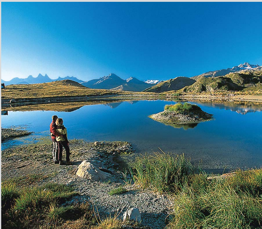
Le Laitalet am Col de la Croix de Fer.

Vom Col de la Croix de Fer ①, 2067 m, die Fahrpiste gegenüber dem Chalet ein paar Meter runter zur Weggabelung und ihr weiter nach rechts in westliche Richtung folgen. Die Piste wendet sich dann nach Süden in ein Hochtal und zieht sich in vielen Kehren an der Westfront der Perrons auf eine kleine Höhenterrasse, dann hinab zur nun sichtbaren Refuge de l'Etendard ②, 2430 m. Am Westufer der Seen Lac Bramant und Lac Blanc entlang. Hinter dem zweiten See wechselt der Pfad die Talseite. Weiter gegen Süden durch Moränengelände zum Beginn der Gletscherzunge des Glacier de St-Sorlin ③, 2715 m.