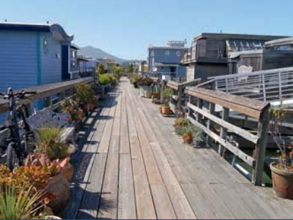
Sausalito Houseboat Community