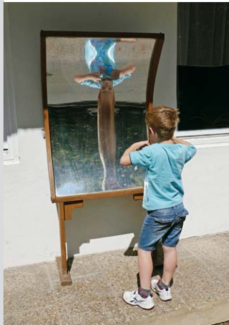
Lustige Grimassen am Zerrspiegel.

Aufseßtal und treffen in Doos auf einen Sinnesparcours. Tipp: Wer nur einen kurzen Ausflug plant, startet direkt von Doos aus.