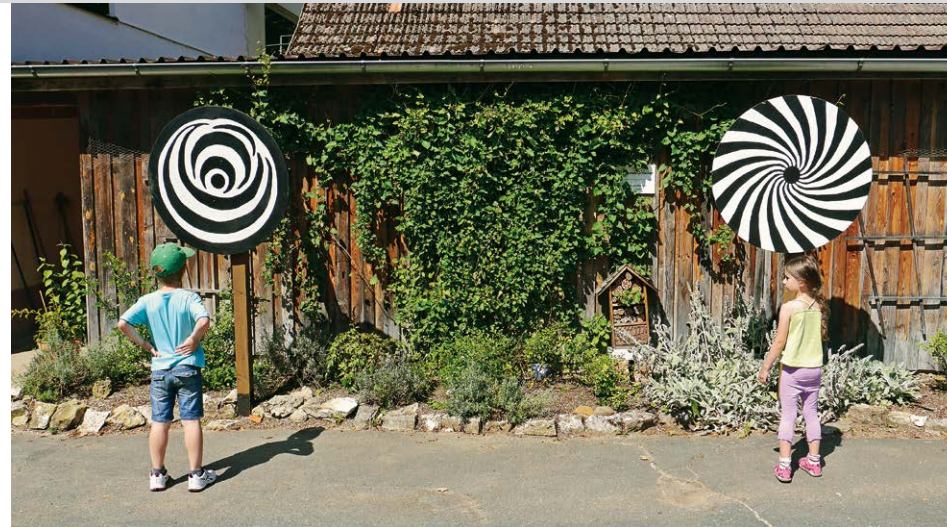
Beim Drehen der Scheiben sehen wir unterschiedliche optische Effekte.

Klappernde Mühle und spannende Höhlenruine Der Name Riesenburg lässt an eine der vielen Burgen in der Fränkischen Schweiz denken, doch es handelt sich hierbei um die Überreste einer Karsthöhle. Diese entstand im Laufe von Jahrmillionen durch Lösungsprozesse im Gestein und wurde später mit Sedimenten aufgefüllt. Als diese durch die Eintiefung des Wiesentales in der jüngeren Erdgeschichte wieder ausgeschwemmt wurden, wurde die Höhlendecke instabil und stürzte schließlich größtenteils ein. Zurück blieben drei sehenswerte große Felsbögen, von denen einer noch überquerbar ist. Vom Tal der Wiesent führen zahlreiche Stufen durch die Versturzhöhle hindurch bis hinauf zu einem Aussichtspunkt. Schon immer waren Maler und Dichter und sogar König Ludwig I. von der Einzigartigkeit dieses Naturdenkmals angetan, und auch Ihre Familie wird begeistert sein. Auf dem Weg dorthin entdecken wir das noch klappernde Mühlrad der Kuchenmühle, durchqueren das ruhige, abgeschiedene