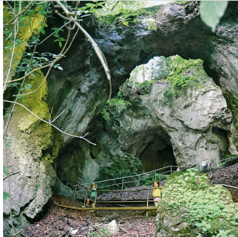
In der Riesenburg – über uns sehen wir den überquerbaren Felsbogen.

wir in einem weiten Rechtsbogen die Versturzhöhle und bewundern die als Relikte der ehemaligen Höhle erhalten gebliebenen drei Felsbögen. Nach Überqueren des mit einem Geländer abgesicherten Felsbogens gelangen wir zum Aussichtspunkt am König-Ludwig-Felsen. Schon viele berühmte Personen haben ihren Blick von hier oben über das Wiesental schweifen lassen. Auf gleichem Weg kehren wir wieder zurück nach Doos (2) und weiter zur Kuchenmühle (1) .