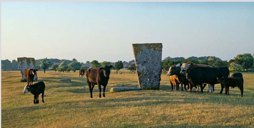
Die beiden Königssteine (Kungsstenarna).

Von dort zurück, halten wir auf die kleinere rote Hütte links zu und gelangen – hinter ihr rechts gehend – über eine Trittleiter zurück auf den Hauptweg. Dort links. Vom rechten hinteren Rand des Parkplatzes aus laufen wir zunächst entlang der Mauer auf unserem Ankunftswege zurück bis