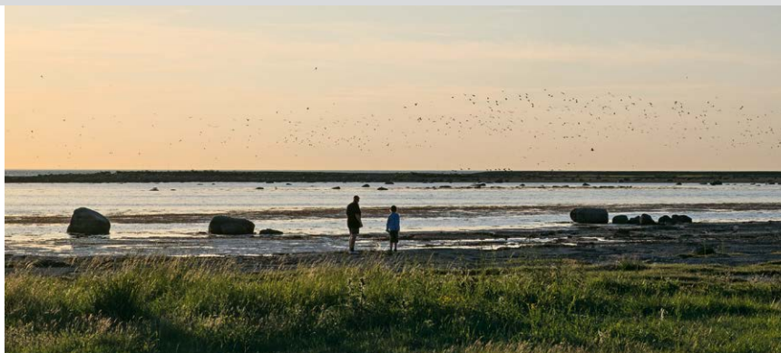
Södra Udde gehört zu den bekanntesten ornithologischen »Hotspots« Schwedens.

Wir starten vom Parkplatz Södra Lunden 1 aus in Richtung Süden und nehmen an der anschließenden Kreuzung den nach Süden führenden Feldweg »Södra Lundtornet« – grüne Markierung). Hinter einem schmalen Gehölzgürtel kommen wir an eine Verzweigung: von dort machen wir zunächst einen Abstecher (H/Z 500 m) nach links zum Södra Lundtornet 2 , einem Aussichtsturm.