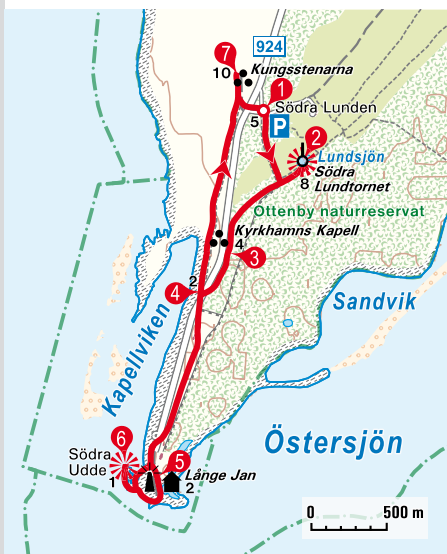
Der fast 42 Meter hohe Länge Jan ist ein Wahrzeichen Ölands.

zum Väg 924 4 , queren die Straße und setzen dann unseren Weg auf einem Wiesenpfad geradeaus fort. Bei einer Verzweigung behalten wir die bisherige Richtung bei und durchqueren Buschland. An der Abzweigung zur Västra Markslingan marschieren wir genauso geradeaus vorbei wie 400 m dahinter an derjenigen zum Parkplatz. Nach 200 m sehen wir die Steinsetzung Kungsstenarna 7 in Form von zwei aufgerichteten Steinplatten vor uns. Dort kehren wir um, biegen nach 200 m links ab und überqueren die Straße geradeaus. Nun haben wir unseren Ausgangspunkt, den Parkplatz Södra Lunden 1 , wieder links vor uns.