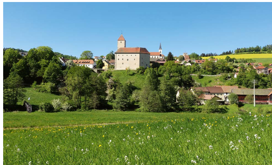
Wunderbarer Blick über das Pfreimdtal zur Burg Trausnitz.

Nach einer Rast steigen wir den Kreuzweg hinab und gehen dann auf dem Sträßchen zum Ortsrand von Trausnitz. Dem roten Kreis folgend wenden wir uns nach links und gehen am Parkplatz vorbei zur Pfarrkirche Sankt Josef. Hinter dieser finden wir im Friedhof den verschlossenen Sachsenturm und unterhalb die Ver-söhnungskapelle 6 mit der Kette über dem Taufbecken. Treten wir aus der Kapelle, verlassen wir den Friedhof nach links, steigen die Stufen hinab und gehen am Brunnen rechts, dann links zum Gasthof »Das Landhaus«. Unterhalb des Gasthofs geht es rechts haltend durch das Tor zur Burg Trausnitz 7 .