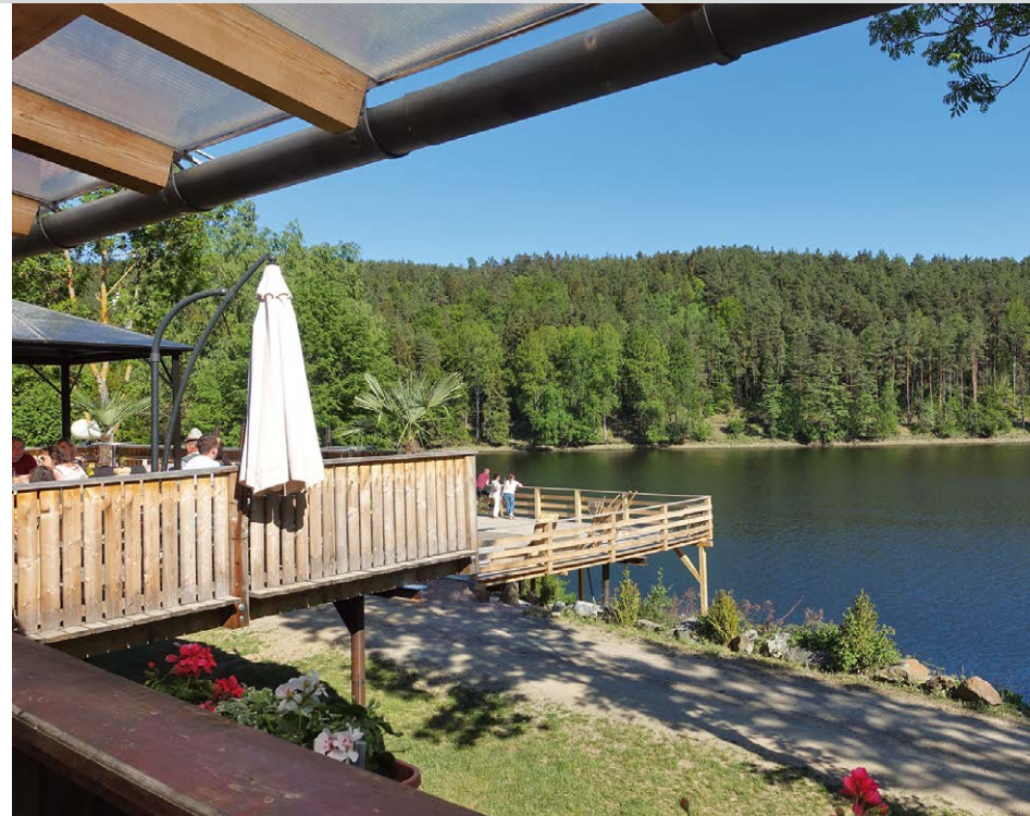
Gastwirtschaft Seeterrasse am Campingplatz Trausnitz neben der Liegewiese.

Ausgangspunkt: Trausnitz, 448 m, Parkplatz mit Wandertafel an der Bogenbrücke, 390 m. Anfahrt über die A 93, Ausfahrt Pfreimd, im Ortszentrum rechts und dann abermals rechts über Stein nach Trausnitz. Am Ortseingang rechts Richtung Atzenhof über die Bogenbrücke und links am Abzweig zu Campingplatz und Werk Reisach parken (Navi: Seestraße, 92555 Trausnitz). Baxi SAD 8401, Tel. +49/(0)9431/8028005, von Wernberg Bahnhof, Pfreimd und Untersteinbach Bahnhof. Anforderungen: Rundtour auf meist markierten Pfaden und Waldwegen mit einigen kleinen Anstiegen. Einkehr: Gastwirtschaft Seeterrasse