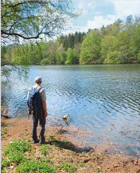
Am Stausee auf dem Weg zur Ödmühle.

Vom Parkplatz bei der Bogenbrücke 1 in Trausnitz gehen wir wenige Meter Richtung Atzenhof und dann mit den Markierungen rotes Rechteck und Rittersteig (rotes Wappen) links in den Wald. Ein steiler Pfad führt kurzzeitig aufwärts, dann teilt er sich. Wir folgen dem Rittersteig nach links. Erst auf einem Pfad, dann auf einem Waldweg erreichen wir den Waldrand mit Aussichtsbank und Blick zur gegenüberliegenden Burg Trausnitz. Der Rittersteig führt bereits hier hinab zur Straße, wir aber bleiben auf dem Waldweg und zweigen erst gut 100 m weiter, an der Stelle, wo der Waldweg wieder anzusteigen beginnt, links ab und gehen mit Geländer gesichert hinab zur Straße. Vor der Brücke zweigt ein mit dem gelben S des Goldsteigs markierter Weg rechts zu einer Wiese an der Pfreimd ab. Wir gehen im Gänsemarsch am rechten Wiesenrand entlang, dann leitet uns die Markierung hinauf zur Zufahrtsstraße eines Wasserkraftwerks. Kurz vor dem Kraftwerk steigen wir rechts