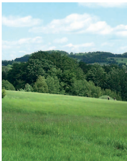
☒ Hochwaldblick vom Gebirgskamm bei Hain

Vom Reichtum der Oberlausitz an Natur und Geschichte und von ihrer einladenden Gegenwart handelt dieses Buch. Es führt in eine moderne, natur-