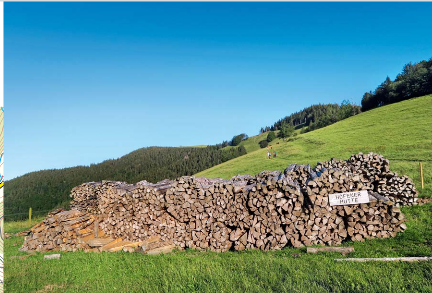
Zwischen Roteck und Häusleberg oberhalb der Höfener Hütte.

Häusleberg und Roteck erklimmt, tritt er wieder in freie Weideflächen ein. Am Sattel besteht die Möglichkeit, rechter Hand über einen nicht beschilderten Wiesenweg direkt zum Rotecksattel anzusteigen – Vorsicht bei eventuellem Weidebetrieb! Ansonsten steigen wir kurz zur Höfener Hütte ④ ab und biegen hier rechts auf die blaue Raute ein, die uns durch die steile Flanke des Rotecks in den Wald und über einen wurzelig-steinigen Pfad in den Rotecksattel ⑤ schickt. Der letzte Aufstiegsteil über aussichtsreiche Wiesen ist der reinste Genuss, dann können wir am Gipfel des Hinterwaldkopfs ⑥, 1198 m, das umwerfende Panorama genießen. Neben dem nahen Feldbergmassiv und den Sankt Märgener und Breitnauer Höhen kann insbesondere der Fernblick über das Dreisamtal hinweg zu den Vogesen überzeugen.