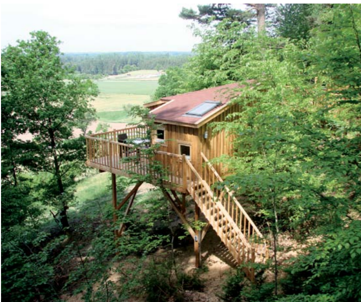
◀ Baupalast ▶ Das Baumhaushotel

tet in die Ruhe und Einsamkeit des Naturpark Spessart steht hier eine fast 400 Jahre alte Mühle im Fachwerk-Stil. Ringsum sind zwischen den Lärchen und Fichten zehn Baumhäuser für zwei bis sechs Gäste entstanden. Die Preise starten pro Haus ab 240 Euro für Übernachtung und Frühstück.