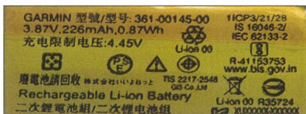
图 3: 标识 Figure 3: Logo