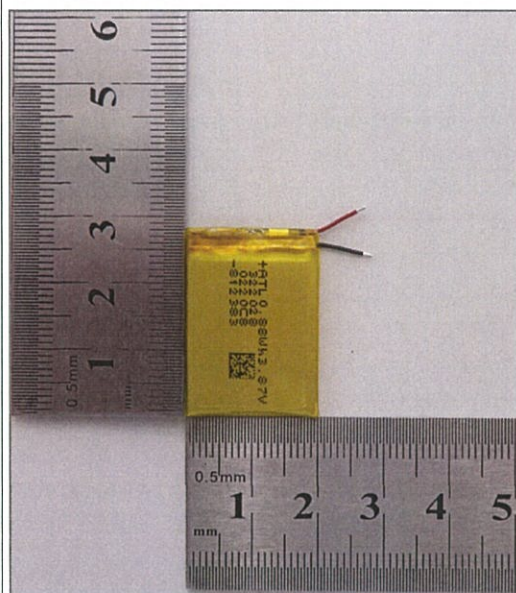
图 2: 反面 Figure 2: negative