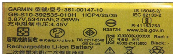
图 3: 标识 Figure 3: Logo