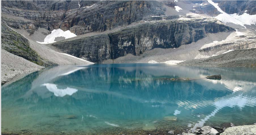
Die Natur braucht kein »digitales Litting«: der Lake Oesa strahlt von ganz allein.

Nun wird's steinig-alpin, wenn wir uns am Westende des Sees an die Nordflanke des Yukness Col begeben und am steinernen Felsmassiv dem blaugelben Zeichen eine Dreiviertelstunde lang ins nächste Tal folgen. Entlang des Steilhanges Richtung Westen ergeben sich tolle Aussichten auf das Tal um Lake O'Hara.