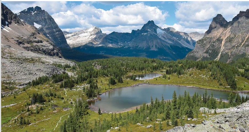
Viele Seen kennzeichnen das offene Tal um den Lake O'Hara im Yoho Nationalpark.

Die Wanderung beginnt an der gemütlichen Le Relais (1) , 2030 m, von der aus wir hinab zum gegenüberliegenden Ufer des anmutigen Lake O'Hara gelangen. Auf dem waldigen Uferweg spazieren wir knappe 900 m, bis uns der beschulderte Abzweig links hinauf zum Lake Oesa verweist. Durch die letzten Baumreihen, über schmale Steinhalden, am hinreißenden Wasserfall und an schimmernden Seen vorbei, geht es die nächste knappe Stunde auf dem attraktiv angelegten Bergpfad die Talstufe hinauf zum kristallklaren, tal-schließenden Lake Oesa (2) , 2260 m.